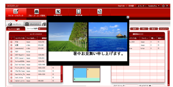
↑ プレイリスト作成のプレビュー画面

表示端末の詳細な監視・管理をリモートから実行。端末で発生するタッチイベント、Felica イベント、端末の動作ログなどを取得可能。