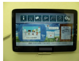
アンドロイドタブレット 10.1 インチ

端末側は、Android 端末にビューワソフトをインストールするだけで、すぐにサイネージを表示できます。スマートフォン、タブレットなど用途やシチュエーションに合わせた端末の利用が可能です。