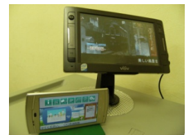
アンドロイド携帯と Windows PC 端末