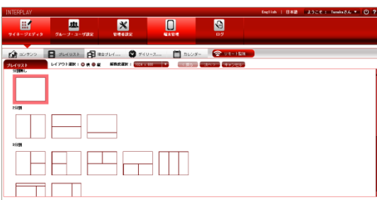
↑ プレイリスト作成のテンプレート選択画面

ディスプレイスタイルに合わせて 47 種類のテンプレートをご用意。分割サイズ・レイアウトは自由に変更可能。