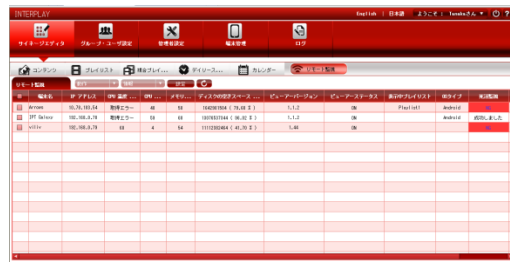
ビューワ端末のリモート監視画面 *2

プレイリストの更新、再生スケジュールの調整から音量調整まで、遠隔地のビューワ端末をリモート管理できます。